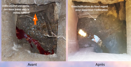
Reprise du regard de l'esplanade

Ainsi, entre août et octobre 2021 des travaux de faible ampleur mais avec un fort impact ont été réalisés :